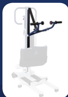
VÉRIN & BRAS DE LEVAGE + SANGLE DE TRACTION